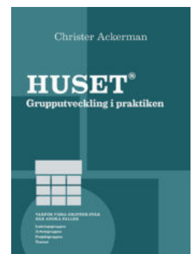
Boken "Huset - grupputveckling i praktiken" av Christer Ackerman

Ingår i kursen: Boken HUSET - Grupputveckling i praktiken , lunch och fika