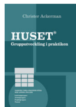
Boken "Huset - grupputveckling i praktiken" av Christer Ackerman

Ingår i kursen: Boken HUSET - Grupputveckling i praktiken , lunch och fika.